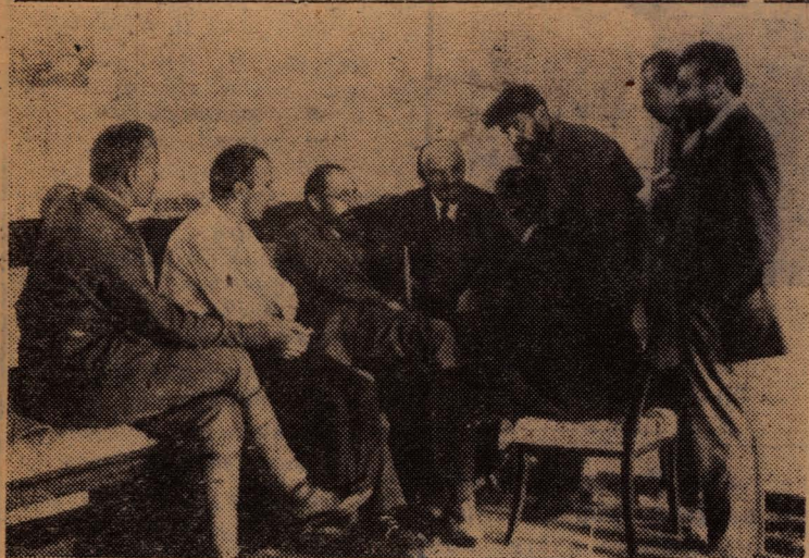
В. И. Ленин в Кремле беседует с итальянскими делегатами II конгресса Коминтерна. Москва, июль-август 1920 года.

23 марта 1922 г., в день получения первой плавки, рабочие отлили обелиск, который и подарили Ленину. Л. ШЕСТАКОВА.