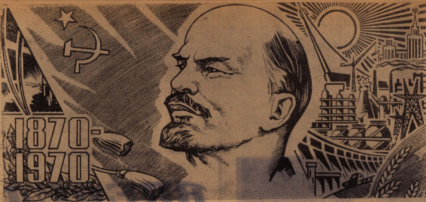
Рисунок художника С. Гринько.