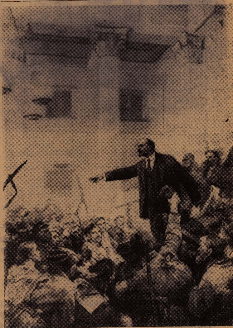
„Ленин провозглашает Советскую власть“. Художник В. Серов.

И. ПИСАРЕВ, персональный пенсионер, член КПСС с 1925 года.