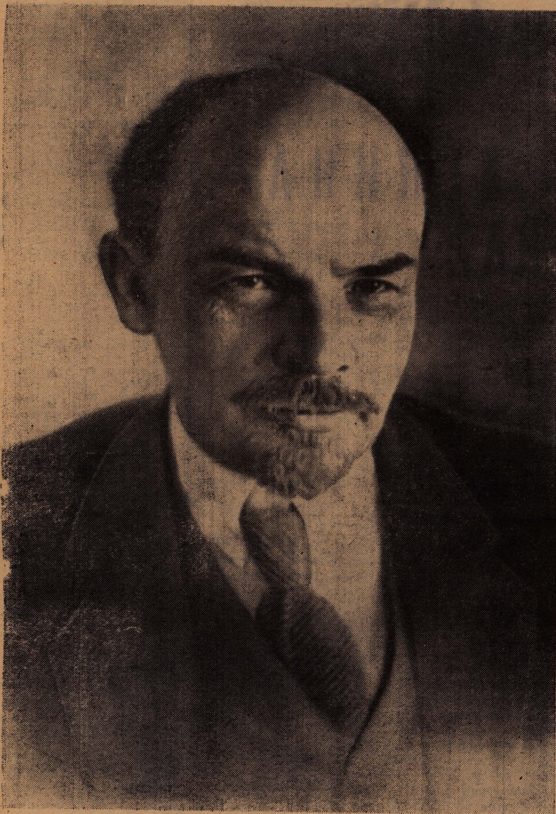
В. И. Ленин. Петроград, январь 1918 года.