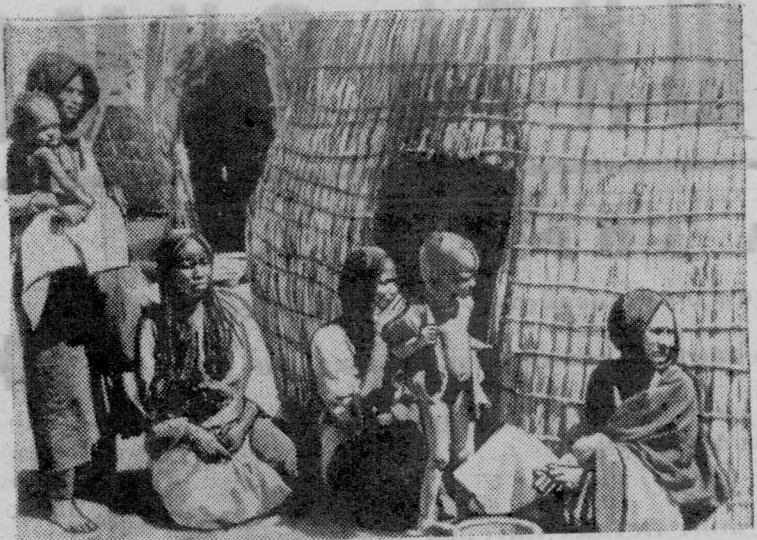
Нигер — государство, расположенное в Центральной Африке. Значительная часть его территории до сих пор не исследована. Основу экономики составляют животноводство и выращивание арахиса.

На снимке: хижины из тростника — типичные жилища в земледельческих районах страны.