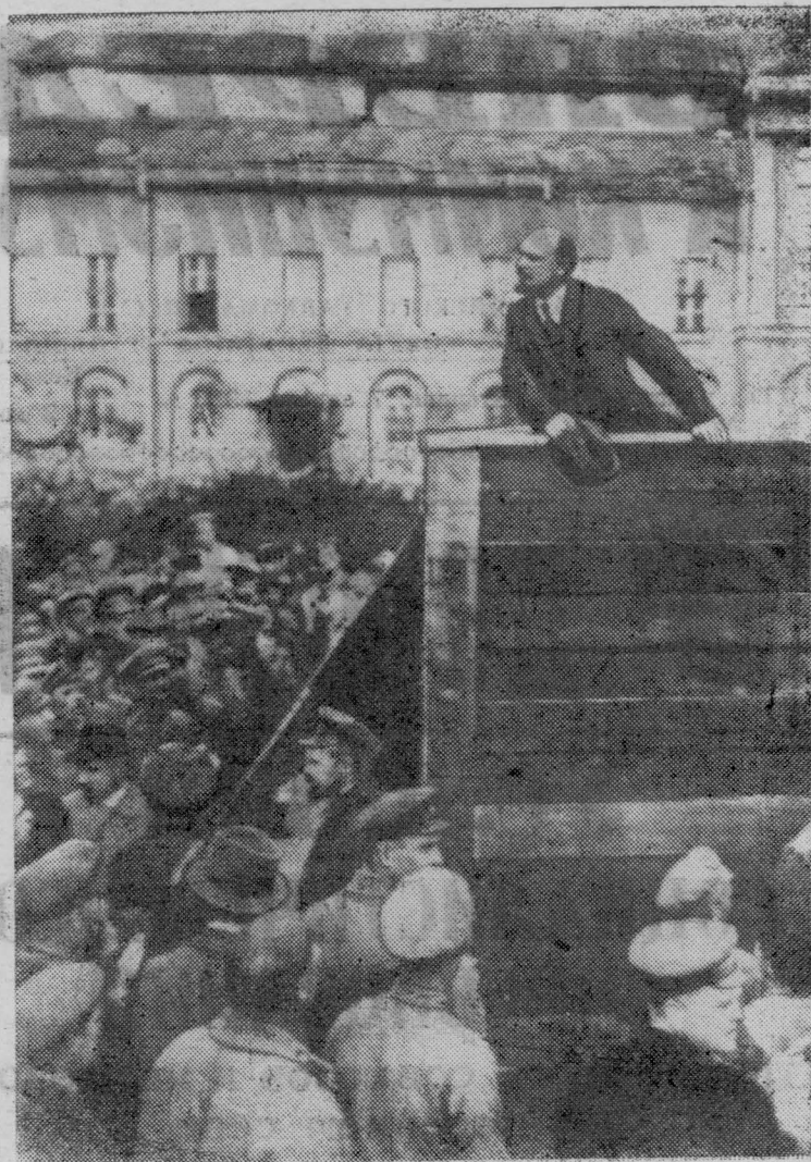
В. И. Ленин выступает с речью на площади Свердлова на параде войск, отправляющихся на польский фронт. 1920 год. 5 мая. Москва.

К 100-ЛЕТИЮ СО ДНЯ РОЖДЕНИЯ В. И. ЛЕНИНА