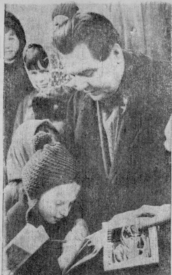
После выступления поэта окружают его читатели. Знакомятся с новыми книгами, обмениваются адресами, автографами.

Сегодня наша литературная страница посвящена творчеству поэта Мстислава Левашова.