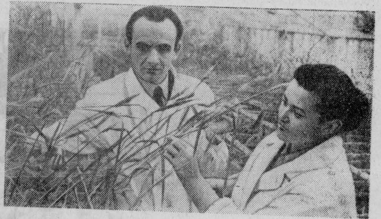
На площади свыше пяти миллионов гектаров в нашей стране высеваются высокопродуктивные сорта и гибриды озимой пшеницы, ячменя, кукурузы и других культур, созданные за последние годы коллективом Всесоюзного селекционно-генетического института (Одесса).