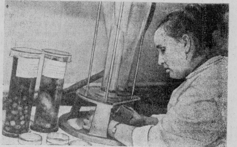
МОСКВА. В отделе гельминтологии Центральной лаборатории по карантину растений Министерства сельского хозяйства СССР при исследовании легких почв на присутствие картофельной нематоды—опасного вредителя, который поражает как корни, так и клубни картофеля, используют сейчас прибор «КСП-1» (семенной пневматический классификатор), обычно применяемый при анализе семян. Прибор «КСП-1» дает возможность быстро выявить присутствие в почве картофельной нематоды, в то время как прежний, флотационный способ таких исследований был длительным и трудоемким.