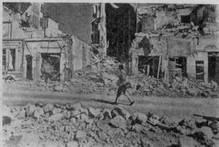
Израильская военщина, продолжая нагнетать напряженность на Ближнем Востоке, совершает варварские налеты на мирные арабские города и селения.

Вместе с тем, Брандт ушел от ответа на предложенный ГДР проект договора об уста-