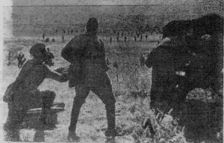
Великая Отечественная война. Бой в излучине Дона.

По обсуждаемому вопросу пленум принял развернутое постановление.