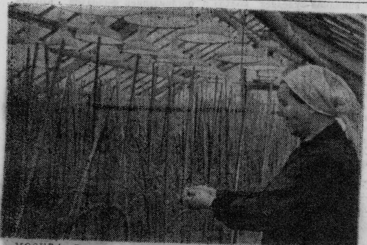
МОСКВА. В лаборатории селекции яровых и зерновых культур Научно-исследовательского института сельского хозяйства центральных районов нечерноземной зоны проводится работа