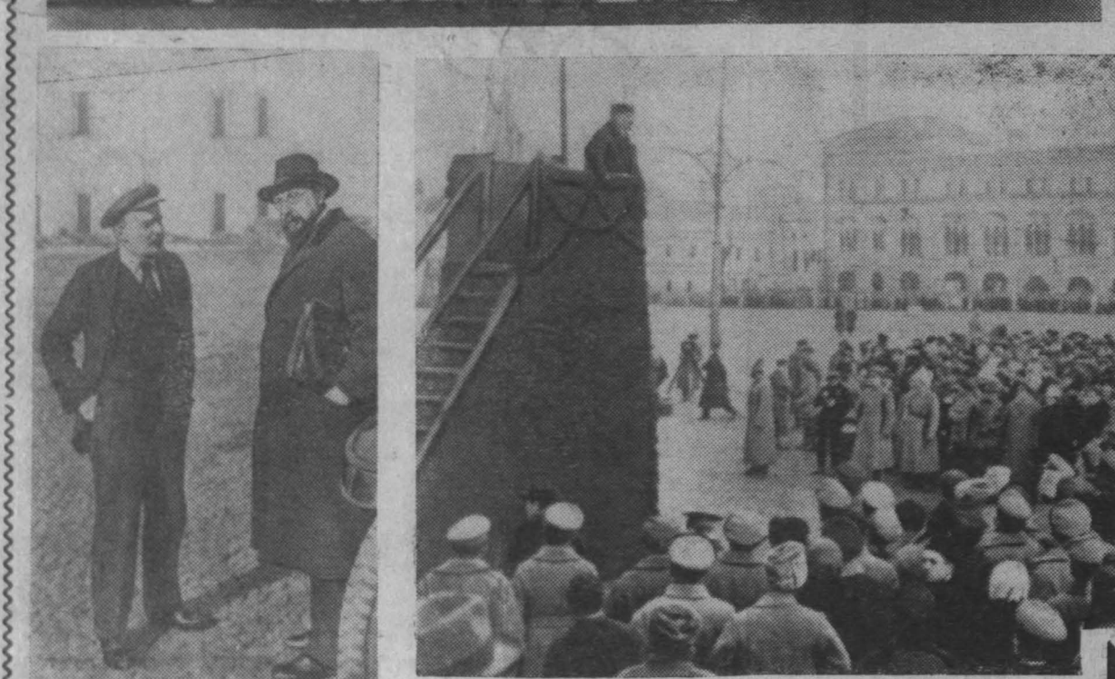
На снимках: сверху — В. И. Ленин и Я. М. Свердлов в президиуме I Всероссийского съезда земотделов и комбедов в Колонном зале Дома союзов, Москва, 11 декабря 1918 года. В. И. Ленин в октябре 1918 года, Москва. В центре — В. И. Ленин и В. Д. Бонч-Бруевич во дворе Кремля. Октябрь 1918 года. В. И. Ленин произносит речь на Красной площади в день празднования 1-й годовщины Великой Октябрьской социалистической революции 7 ноября 1918 года.