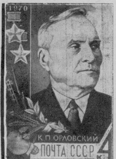
МОСКВА. Министерство связи СССР готовит к выпуску почтовую марку, посвященную Герою Советского Союза, командиру партизанского отряда Белоруссии, Герою Социалистического Труда бывшему председателю колхоза «Рассвет» Белорусской ССР К. П. Орловскому.

ДНИ ВЫХОДА ГАЗЕТЫ ВТОРНИК, ЧЕТВЕРГ, СУББОТА.