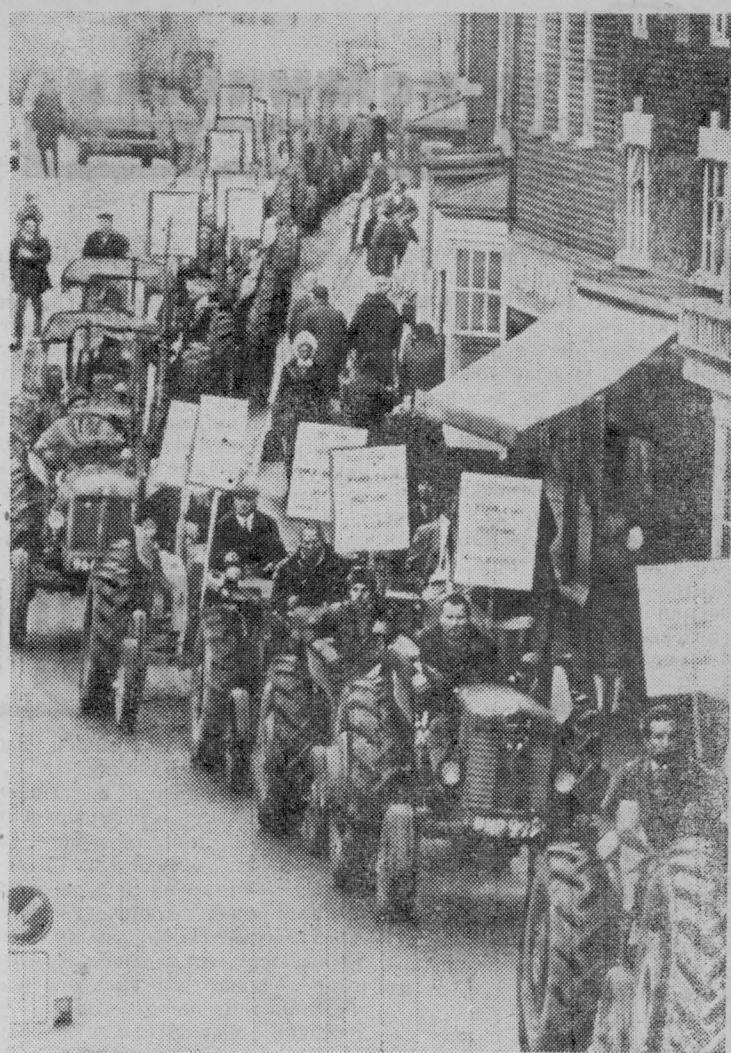
Все новые слои трудящихся Англии вступают в борьбу за улучшение условий труда и принятие мер по сдерживанию непрекращающегося роста цен.

Свое недовольство политикой правительства выражают и английские фермеры, которые регулярно организуют демонстрации с требованием изменения системы закупок сельскохозяйственной продукции и увеличения субсидий.