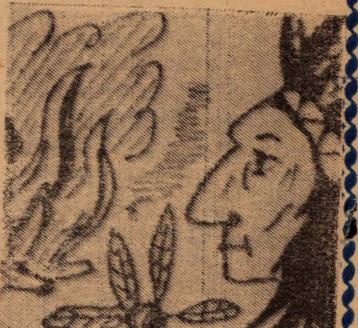
Рис. А. НОВИКОВА.