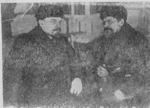
На снимке В. И. Ленин и М.И. Калинин в Доме Союзов во время работы I Всероссийского съезда трудовых казаков. Москва, 1 марта 1920 года.