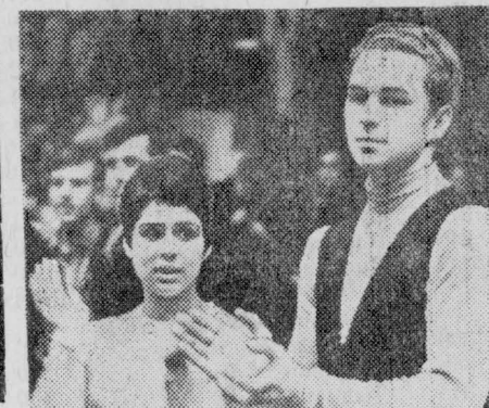
На прошедшем в Ленинграде первенстве Европы чемпионками в парном катании второй раз подряд стали советские спортсмены Ирина Родицина и Алексей Уланов.