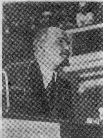
На снимках (справа налево): В. И. Ленин выступает с докладом о международном положении на заседании II конгресса Коминтерна. Петроград, 19 июля 1920 года.