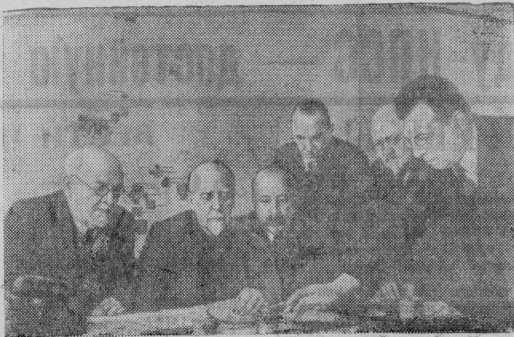
Фото 1940 года. Репродукция из фондов ленинградского музея

Члены Государственной комиссии по электрификации России (ГОЭЛРО). Слева направо: К. А. Круг, Г. М. Кржижановский, Б. И. Угрюмов, Р. А. Ферман, Н. Н. Вашков, М. А. Смирнов.