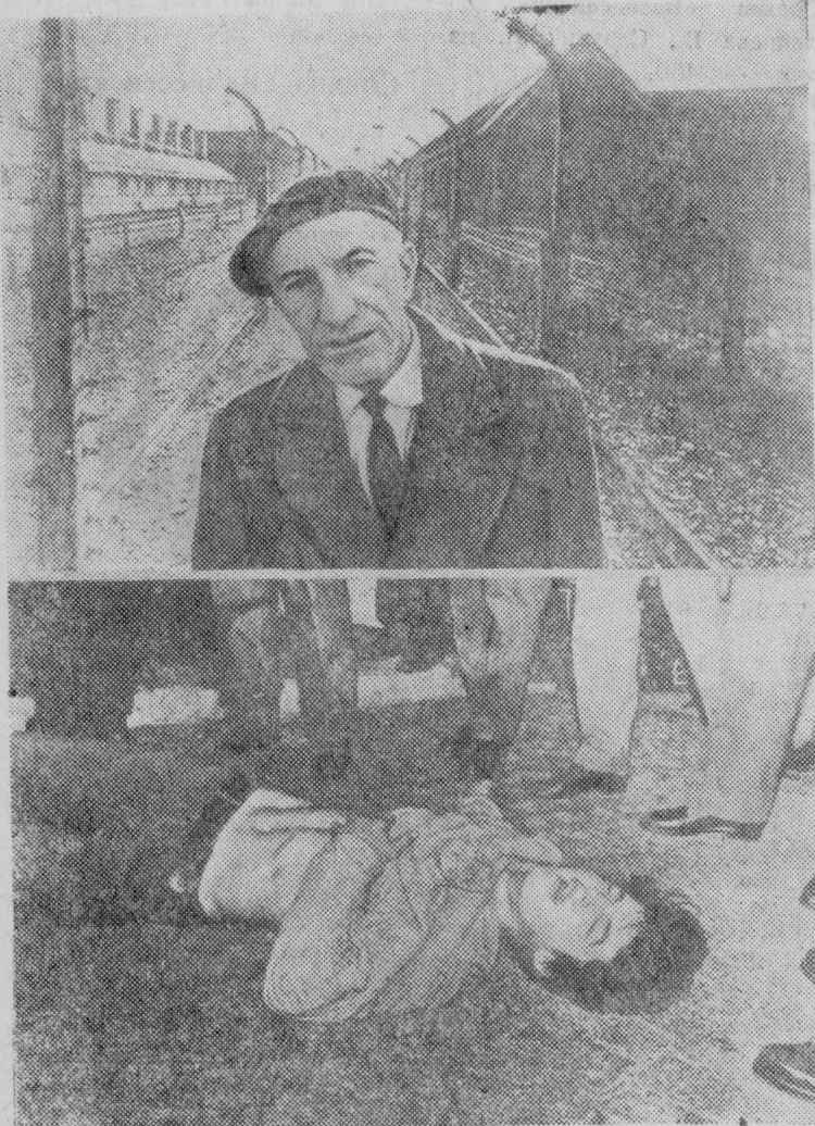
Вверху — снимок из серии «Освенцим, Биркенау, Майданек» западногерманского фоторепортера М. Рютца, удостоенной серебряной медали по разделу фоторепортажа на международной фотовыставке «Интерпрессфот-70» в Праге. Внизу — снимок из серии «Полиция в Федеративной Республике Германии» западногерманского фоторепортера А. Кемпенса, которой присуждена серебряная медаль по разделу фоторепортажа на международной фотовыставке «Интерпрессфот-70» в Праге.