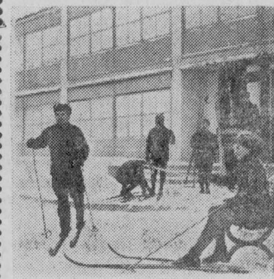
АРХАНГЕЛЬСКАЯ ОБЛАСТЬ. В старинном городе Сольвычегодске есть межколхозный санаторий. Работники сельского хозяйства из Архангельской, Вологодской, Кировской и Мурманской областей, Коми АССР проводят здесь свой отпуск. Лечебные грязи, минеральная вода, комплекс физиотерапевтических процедур способствуют улучшению здоровья трудящихся. На снимке: на лыжную прогулку.