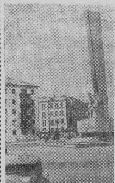
УЛАН-УДЭ. Памятник воину Бурятии, погибшему смертью героя в годы Великой Отечественной войны. Здесь заложено письмо комсомольца двадцать первого века.

Последнюю, двадцать первую свадьбу называют коронной и справляют ее через семьдесят пять лет.