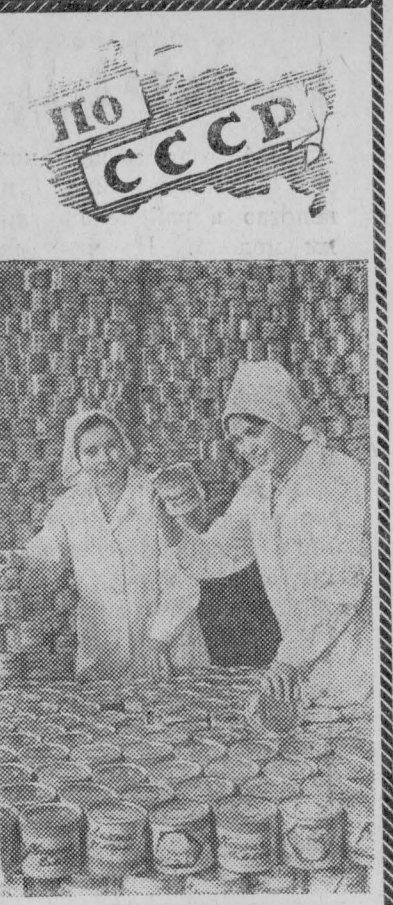
МОЛДАВСКАЯ ССР. Продукция Тираспольского консервного завода имени Первого мая известна жителям многих городов Союза, экспортируется за рубеж. В нынешнем году предприятие выпустило сто тридцать пять миллионов банок овощных и фруктовых консервов — на десять миллионов больше, чем в минувшем году.