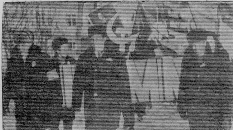
На снимках: слева — колонна швейной фабрики № 8. Праздничные торжества у коллектива швейной фабрики особенные — досрочно выполнен пятилетний план; справа — колонна трудящихся ЦРММ. Ремонтники также одержали заслуженную победу, завоевав первенство в социалистическом соревновании по итогам третьего квартала.