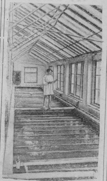
Хлорелла — зеленая водоросль, содержащая в себе до 40-50 процентов белка, витамины, жиры.

В колхозе «Червоный маяк» Боровского района Харьковской области создан цех по ее выращиванию. Опытная партия свиней, в корм которых добавляли хлореллу, дала прибавку в весе на 19-20 процентов больше, нежели животные при обычном питании.