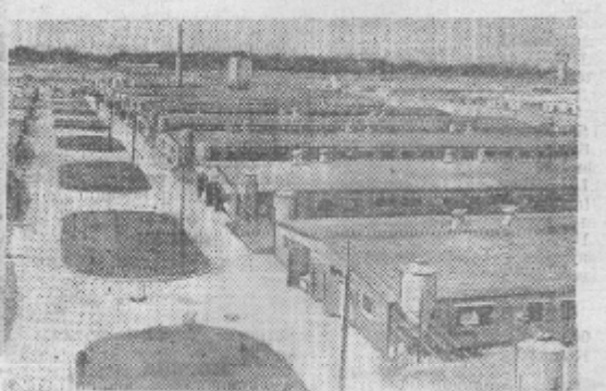
Киевская область. С каждым днем набирает мощь одна из крупнейших цементных фабрик на Украине—Морозовская. В настоящее время здесь ежедневно производится более одного миллиона килограммов высококачественного цемента. Все производственные процессы на фабрике механизированы. Благодаря внедрению передовых методов труда вырабатываемый цемент сократил с 80 дней до 72.

В будущей пятилетке цементная фабрика полностью будет переведена на электрический привод.