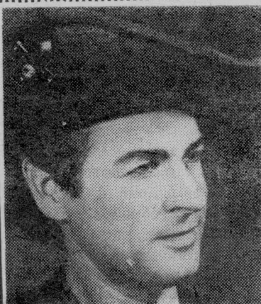
ПНР. Станислав Микольский — популярный польский актер. Он хорошо известен советским телезрителям по многосерийному фильму «Ставка больше, чем жизнь», в котором исполняет роль капитана Клауса.

Яйская районная типография управления по печати Кемеровского облисполкома Тираж 3505 экз. Заказ 1152.