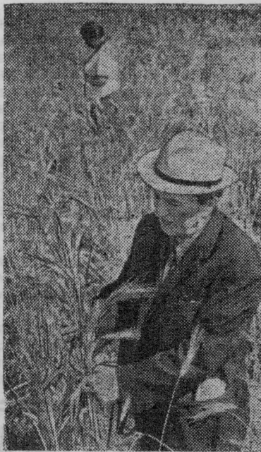
Вблизи Ленинграда расположен Биологический научно-исследовательский институт Ленинградского Государственного университета имени А. А. Жданова.

Ученые, среди которых 70 докторов и кандидатов наук, ведут разнообразную работу в области генетики сельскохозяйственных растений, их корневого питания, исследований проблем гидропоники и изучения физиологических процессов сельскохозяйственных животных. Многие рекомендации ленинградских ученых находят применение в народном хозяйстве. Гордость института — работа сотрудников лаборатории генетики растений по выращиванию нового сорта озимой ржи.