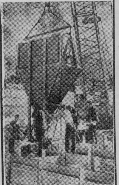
ИРКУТСКАЯ ОБЛАСТЬ. В нынешнем году на территории Усть-Илимского и Нижнеилимского районов организовано пять новых совхозов. Студенческие строительные отряды из многих областей и автономных республик нашей страны ведут строительство подъездных дорог, жилищных домов, школ, детских садов, магазинов. На снимке: строительство овощехранилища в новом совхозе «Коршуновский» ведет трест «Коршуновстрой» и студенческий строительный отряд «Чувашия».

За последние выдавшиеся погожие дни во всех хозяйствах управления получена прибавка к заготовке кормов. Особенно это заметно в колхозах и совхозе „Улановский“. В целом же по управлению прибавка составила три процента к плану.