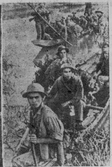
Южновьетнамские патриоты продолжают наносить чувствительные удары по американо-сайгонским войскам на территории всей страны.

Особенно ожесточенные бои происходили недавно в провинции Тхыатхуен. В районе высоты 935 в этой провинции американские интервенты потеряли за 23 дня боев 1700 человек убитыми и ранеными.