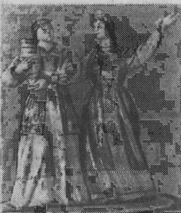
Свыше ста скульптур и этюдов представлено на выставке произведений заслуженного деятеля искусств РСФСР и Якутской АССР Прокопия Ивановича Добрынина, которая открылась в Якутске.