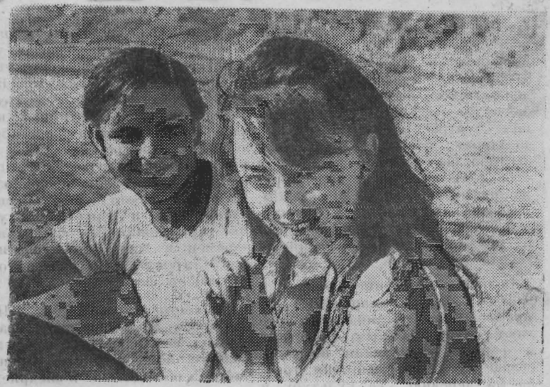
На студии «Узбекфильм» завершается съемка фильма «Влюбленные». Кинолента рассказывает о современной молодежи, судьбах рабочих парней, их любви, становлении характера молодых людей в наши дни. Фильм снимается по сценарию Одельи Авишева. Режиссер-постановщик Эльёр Ишмухамедов, оператор — Гасан Тутунов.