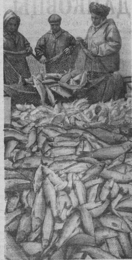
По добыче, переработке и потреблению рыбы Советский Союз занимает одно из ведущих мест в мире. Наш рыболовный флот ежегодно пополняется мощными судами, оснащенными современной техникой. В год ленинской годовщины советские рыбаки и работники перерабатывающей промышленности работают с особым подъемом.

Рабочий поселок Яя, улица Советская, дом № 8, ТЕЛЕФОНЫ: редактора 1-0, зам. редактора и ответственного секретаря—1-113; отдела сельского хозяйства, культуры, быта и писем трудящихся—1-113 (два звонка), типографии—0-31.