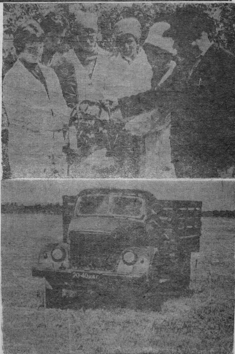
На снимках: победители сельской профессионально-технической спартакиады, проходившей 23 июня на территории совхоза «Яйский».