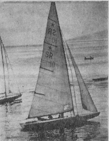
ВЛАДИВОСТОК. Амурский залив — любимое место отдыха горожан. На его берегу расположились водные станции спортивных обществ, стадион, пляжи. Гладь залива рассекают сотни спортивных яхт, байдарок, каноэ.

На снимке: спортсмены на тренировке в Амурском заливе.