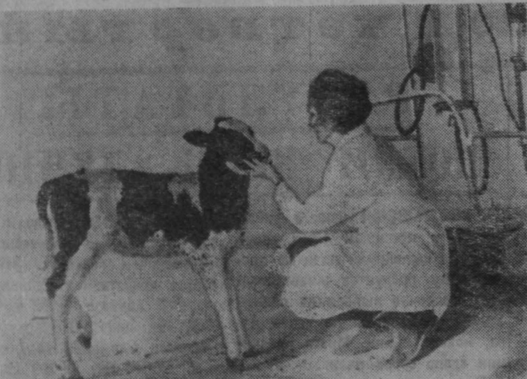
МОСКОВСКАЯ ОБЛАСТЬ. На ферме Научно-исследовательского института сельского хозяйства центральных районов нечерноземной зоны выращивают племенную молодняк для продажи колхозам и совхозам. Племенные коровы дают по 5000 килограммов молока в год при жирности 4 процента.

ВЫХОД ПОРОСЯТ НА ОСНОВ- НУЮ СВИНОМАТКУ 18 16