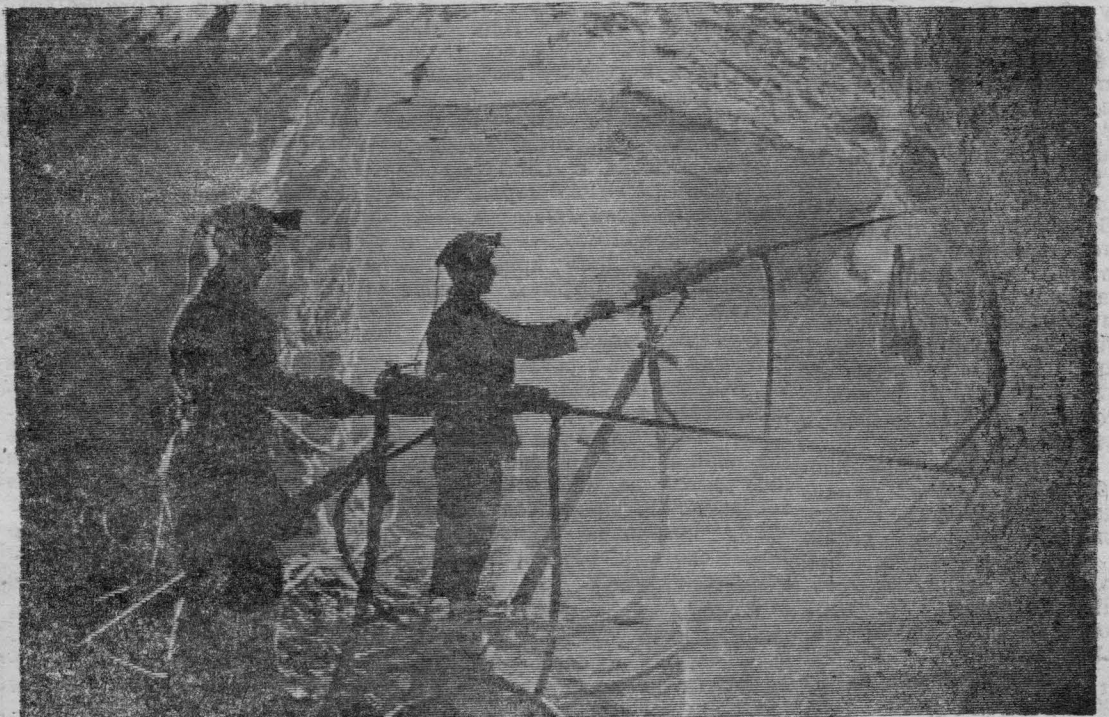
Таштагольский рудник — один из первых и главных поставщиков железной руды для металлургических предприятий Кузбасса. Сейчас на руднике идет подготовка к выемке руды с нулевого горизонта. Горняки взяли повышенные обязательства к 100-летию со дня рождения В. И. Ленина. Промышленная разработка горизонта началась в этом году.

МОРОЗНОЙ выдалась криваются инеем. Прав- елок (не в лесу, конеч- ботников, о чем жители нынешняя зима. Но да, работники пароси- но, а в своих квартирах улиц Чехова и Нахимова у кого теплая квартира, лового хозяйства лесочуть ли не в пальто и быют тревогу уже трет- это не беда: мороз то- промышленного комби- шапках). Не весело при- тий год. Но все тщетно! же по-своему приятен. ната с наступлением ходится и продавцам Не пора ли руководи- Однако для жителей больших морозов успо- магазина «Березка», ко- телям ЛПК основательно улиц Чехова и Нахимо- каивали, вот поступит, торый тоже подключен решить вопрос с котель- ной, сделать все возмож- каивали, вот поступит, торый тоже подключен ное для создания нор- хорошего в этом мало, да отогреться. И люди Дело, конечно, не- мальных условий для ра- так как температура в терпеливо ждали. только в угле. Главная боты и отдыха людей. их квартирах вот уже Наступил Новый год. беда заключается в ма- жителям Яйских Черему- способленной котельной, Жители улиц Чехова и Нахимова. р. п. Яя. дительное время оста- Но он был омрачен для лощной и плохо при- ется низкой. В резуль- жителей Яйских Черему- а также в низкой трудо- домов иногда сплошь по- дили хорорывды вокруг вой дисциплине ее ра-