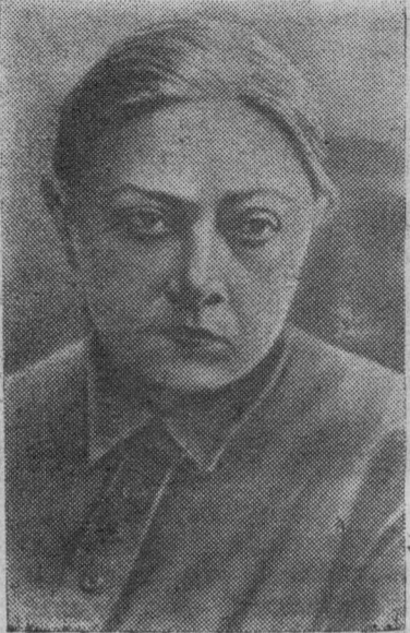
На снимке: Н. К. Крупская.