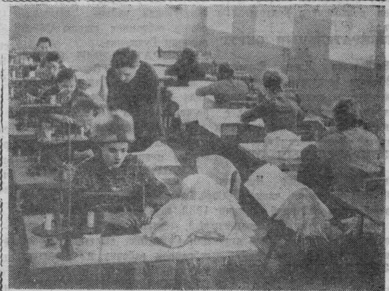
Московская область. В совхозе «Заря коммунизма» работает цех по пошиву спецодежды (на снимке). Здесь шьют халаты, куртки, комбинезоны, рукавицы, фартуки.