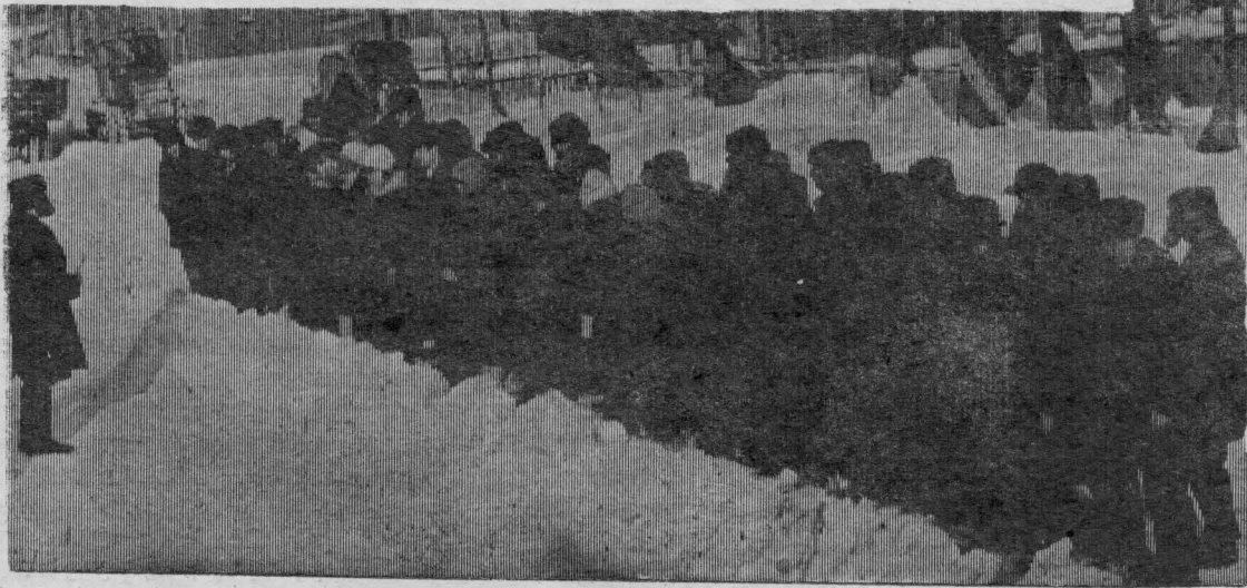
На снимке: участники спартакиады.