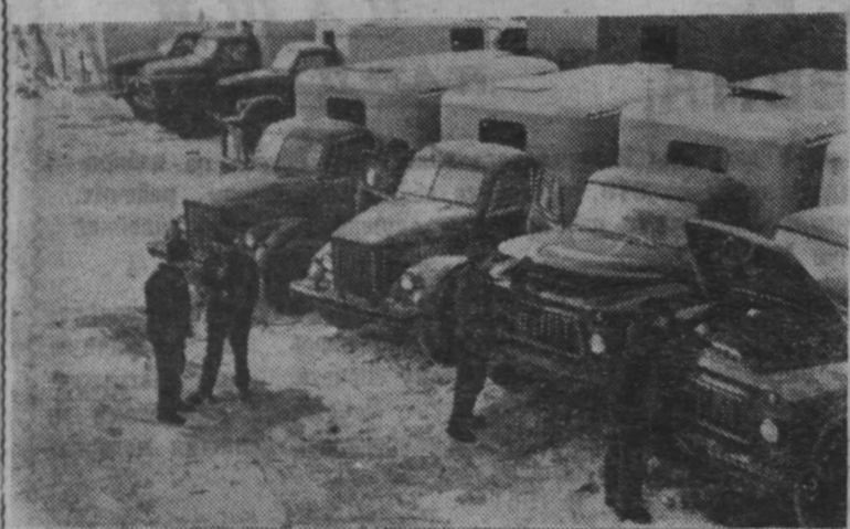
Оренбург. Тысячную автомашину бытового обслуживания для сельской местности выпустил недавно Оренбургский ремонтно-механический завод.

Обком комсомола призывает всех молодых животноводов и комсомольские организации колхозов и совхозов принять активное участие в смотре.