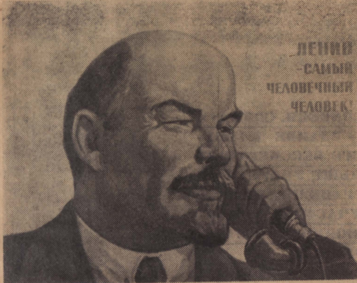
ЛЕНИН САМЫЙ ЧЕЛОВЕЧНЫЙ ЧЕЛОВЕК

Москва. Плакат художника В. Иванова «Ленин — самый человеческий человек». Экспонируется на выставке «Издательство «Советский художник» к 100-летию со дня рождения В. И. Ленина, открытой в Комитете по печати при Совете Министров СССР.