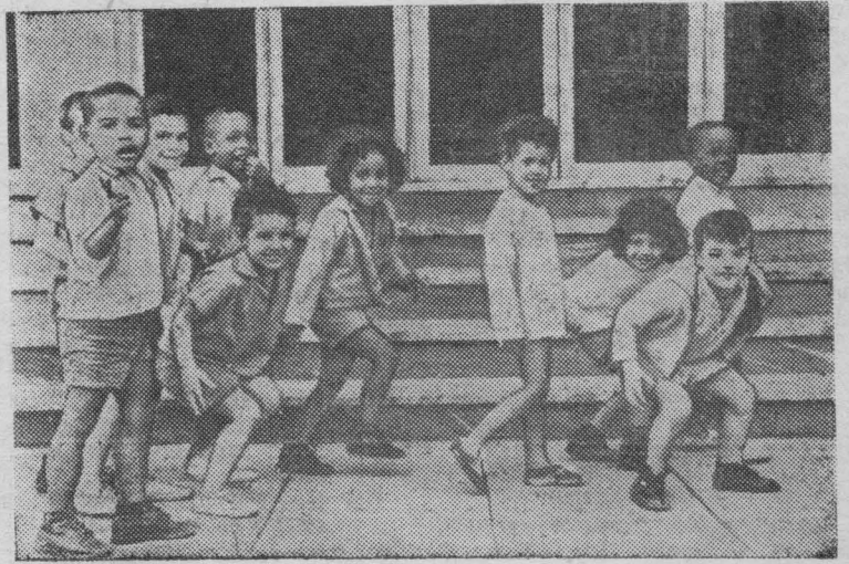
Республика Куба. Вниманием и заботой окружил кубинский народ молодое поколение. Для малышей созданы детские сады и ясли.

На снимке: воспитанники одного из детских садов Гаваны возвращаются после прогулки.