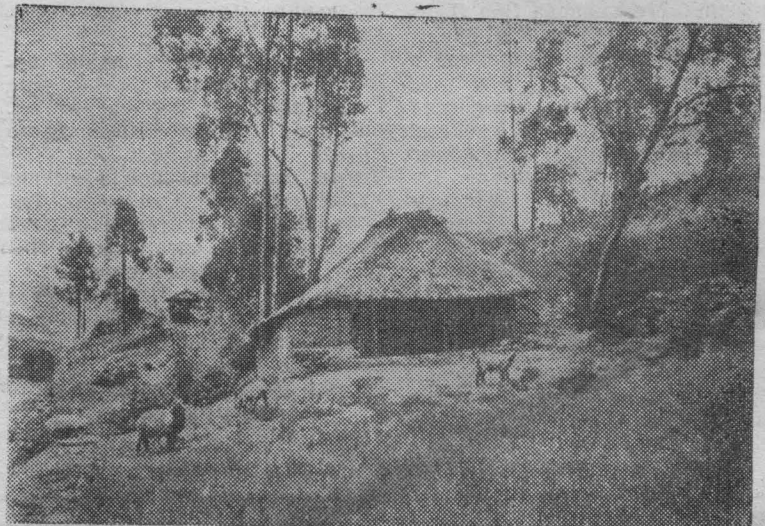
Эквадор. Так выглядит ранчо эквадорского крестьянина. В настоящее время бананы — основной сельскохозяйственный продукт страны. Они составляют более половины всего экспорта. Крестьяне Эквадора страдают от нехватки земли, большая часть которой принадлежит помещикам.