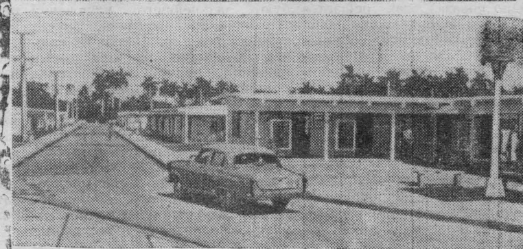
Одна из улиц сельского поселка.