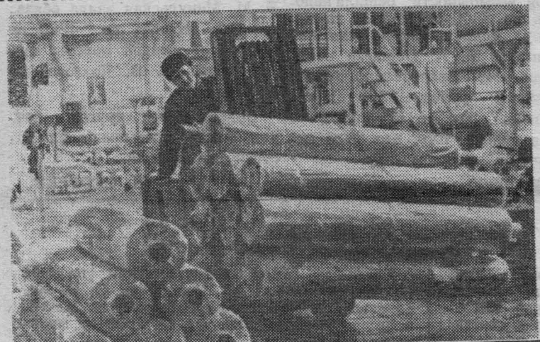
МОСКВА. Коллектив Дорогомилевского химического завода имени М. В. Фрунзе, соревнуясь за досрочное выполнение пятилетки к 7 ноября 1970 года, принял обязательство—в этом году на 20 процентов увеличить выпуск полиэтиленовой пленки. Пленка из полиэтилена сейчас широко используется при строительстве теплиц и парников, а также в различных отраслях народного хозяйства. На снимке: отгрузка готовой продукции из цеха.

ные мероприятия парткома и рабочкома позволили в прошлом году труженикам нашего совхоза перевыполнить взятые социалистические обязательства по животноводству. Намного выше против прошлых лет получен урожай картофеля и овощей, на производстве которых специализируется наше хозяйство. Обобщая и пропагандируя накопленный опыт работы передовиков сельскохозяйственного производства, профсоюзные организации под руководством парткома будут и в дальнейшем делать все, чтобы мобилизовать тружеников совхоза на выполнение взятых обязательств в честь 100-летия со дня рождения В. И. Ленина и досрочное выполнение заданий пятилетки. А. КРЕСТЬЯННИКОВ, заместитель секретаря парткома совхоза «Анжерский».