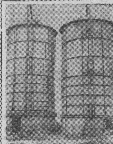
Латвийская ССР. В колхозе «Сарканайс стрелинке» Рижского района построены две оригинальные башни для хранения сена и сенажа. На их сооружении использованы терезо, шифер, полиэтиленовая пленка. В деревянной башне, не пропускающей воздуха, сенаж может храниться два-три года, не теряя питательных веществ. Сено в башне, собранной из терфорированного шифера, также может храниться продолжительное время. На снимке: готовые башни для сенажа (слева) и сена.