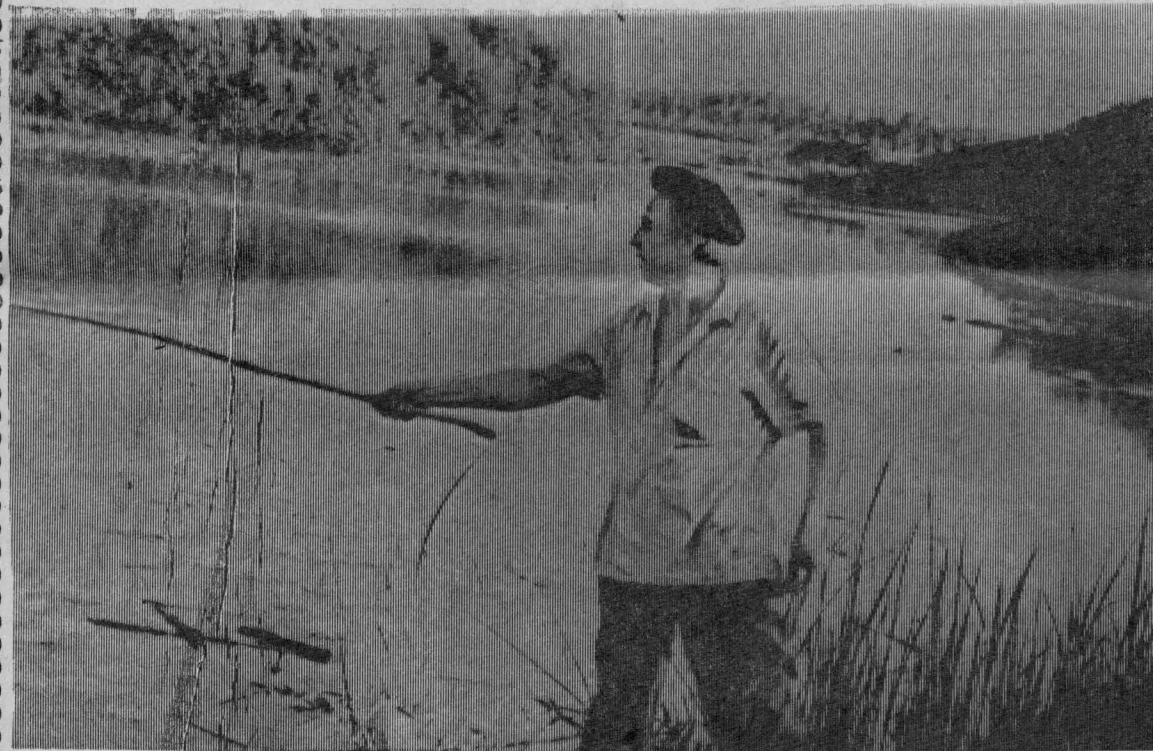
Наш земляк поэт В. Д. Федоров на берегах Яи, у села Марьевки.

Василий Федоров—известный советский поэт, автор целого ряда поэтических сборников и нескольких поэм «Ленинский подарок», «Белая роща», «Проданная Венера», «Седьмое небо» и др.—наш земляк нынешним летом побывал в своем родном селе Марьевка.