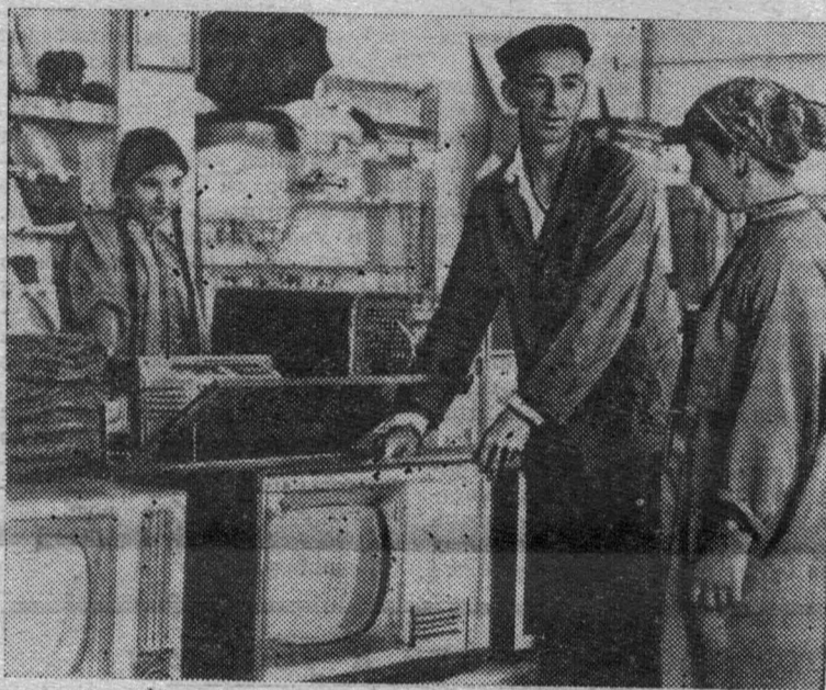
Туркменская ССР. В универсаме колхоза «Мир» Ашхабадского района.

Обслуживанием населения занято около 22 миллионов человек, каждый четвертый работник народного хозяйства. В перспективе в этой сфере будет занята примерно треть всех работающих. Сегодня индустрия удобств оказывает населению около 400 различного вида услуг.