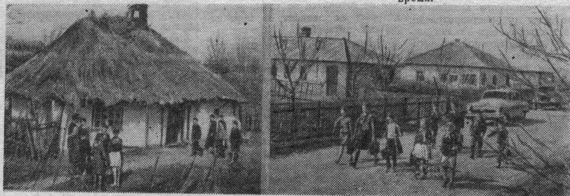
Ивано-Франковская область. Неузнаваемо изменились села Прикарпатья за годы Советской власти. Только за последние несколько лет в колхозном селе Стецева Снятынского района построены Дворец культуры, средняя школа, поликлиника и больница, гостиница, столовая. Почти все колхозники переселились в новые благоустроенные дома.

Сейчас принимаются энергичные меры по устранению имеющихся недостатков. В частности, организован Всесоюзный институт по изучению спроса и конъюнктуры торговли. Он будет заниматься научным планированием производства и распределения товаров. Серьезное внимание обращается на улучшение работы рынков. Приняты новые правила торговли на них, удобные и для продавцов и для покупателей.