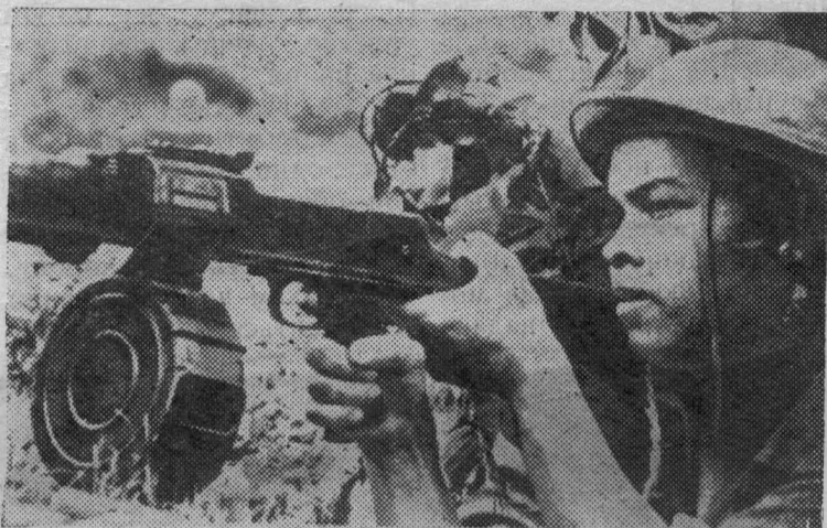
ЮЖНЫЙ ВЬЕТНАМ. Воин армии Освобождения в бою с противником в провинции Куангчи.

За 10 с половиной лет со дня своего основания госпиталь обследовал более 274 тысяч пострадавших от атомной бомбардировки. Было госпитализировано 2729 человек. 515 из них врачи уже не смогли помочь.