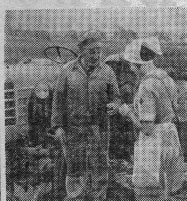
Польша. Медицинская сестра оказывает трактористу первую помощь.