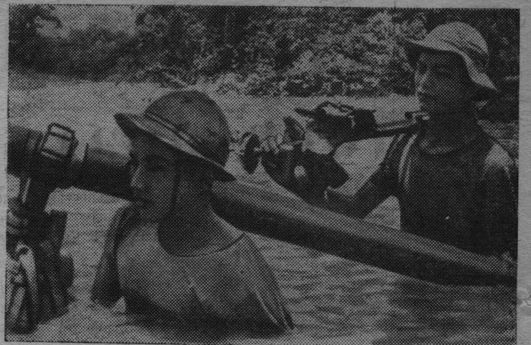
Южный Вьетнам. Воины армии Освобождения преодолевают водную преграду.

БОНН. По объему финансовой и материальной помощи Сайгонскому правительству ФРГ занимает сейчас второе место после США, сообщает газета «Штутгартер цайтунг». Только в течение последних двух лет общая сумма помощи Бонна сайгонскому режиму составила 64 миллиона марок.