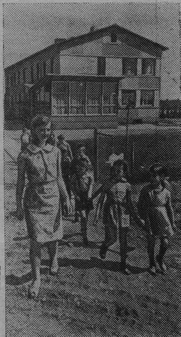
В совхозе «Мадлиена» открыт новый детский сад. Круглосуточные дошкольные, детские учреждения работают в ста совхозах республики.

Нет смысла проводить сравнения с 1920 годом — годом, когда над древней армянской землей взошла заря свободы, — чтобы показать, какой стала советская Армения в братской семье народов СССР. Разве это не осуществленная мечта, когда учится каждый четвертый житель республики? И становится понятно, почему работы армянских ученых завоевали мировое признание — исследования здесь ведутся в 100 научных учреждениях. В их распоряжении и всевидящее око знаменитой Бюраканской астрофизической обсерватории, и мощный электронный ускоритель, вступивший в действие в первые дни второго года пятилетки.