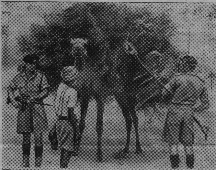
АДЕН. Непокойно на юге Аравийского полуострова. Продолжаются выступления населения против английских колонизаторов.

Британские солдаты обыскивают все грузы, прибывающие в город Аден. В каждой рыбацкой лодке, в каждой крестьянской повозке им мерещится оружие.