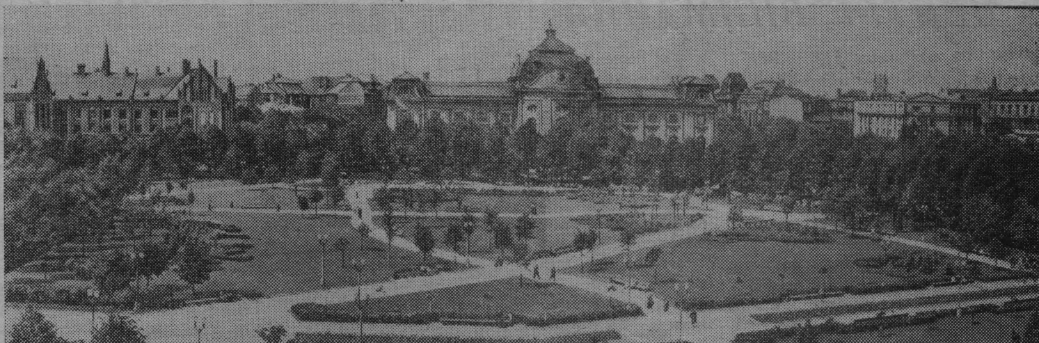
РИГА. Сквер на площади Коммунаров.

В расцвете сил и могущества встречает наша Родина свой полувек юбилей. О завоеваниях Октября и неразрушимой братской дружбе народов, о жизни 15 союзных республик страны рассказывают корреспонденты ТАСС. Сегодня мы предлагаем вниманию читателей материалы о жизни Латвийской ССР, Армянской ССР и Эстонской ССР.