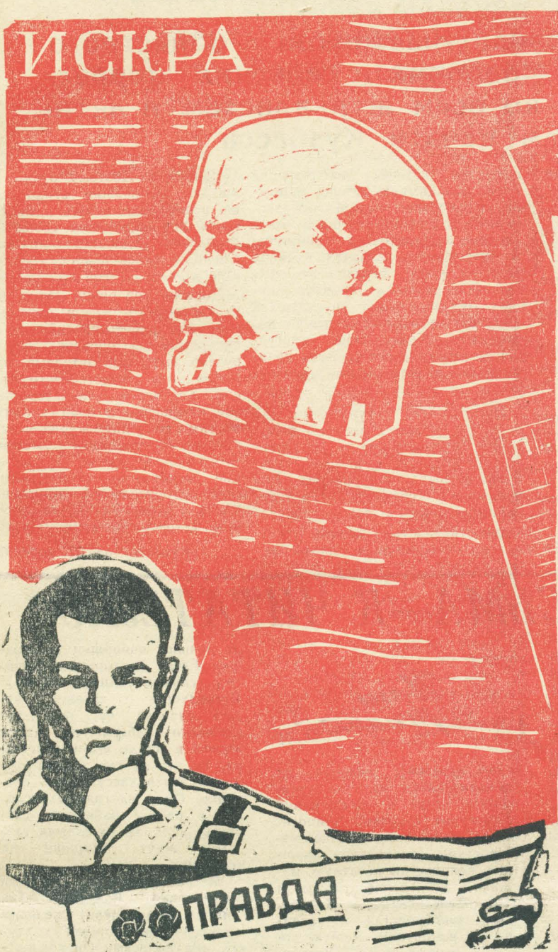
Рисунок В. Литвинова.