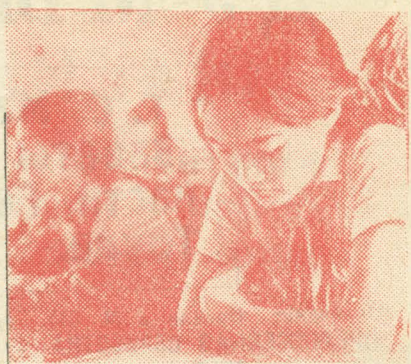
ДЕМОКРАТИЧЕСКАЯ РЕСПУБЛИКА ВЬЕТНАМ. На уроке в школе в деревне Дай Ким.

ловых Варах на благо мира и безопасности в Европе» — таким заголовком открывается номер газеты «Нойес дойчланд». Газета пишет, что заявление участников конференции, интересная и важная речь тов. Брежнева в Карловых Варах представляет собой план обеспечения мира в Европе, мирного сосуществования и сотрудничества европейских государств. РИМ. «Сама идея европейской безопасности на встрече в Карловых Варах расширилась и обогатилась», — пишет газета «Уни-та», подводя итоги конференции европейских коммунистических и рабочих партий. Безопасность, отмечает газета, рассматривалась