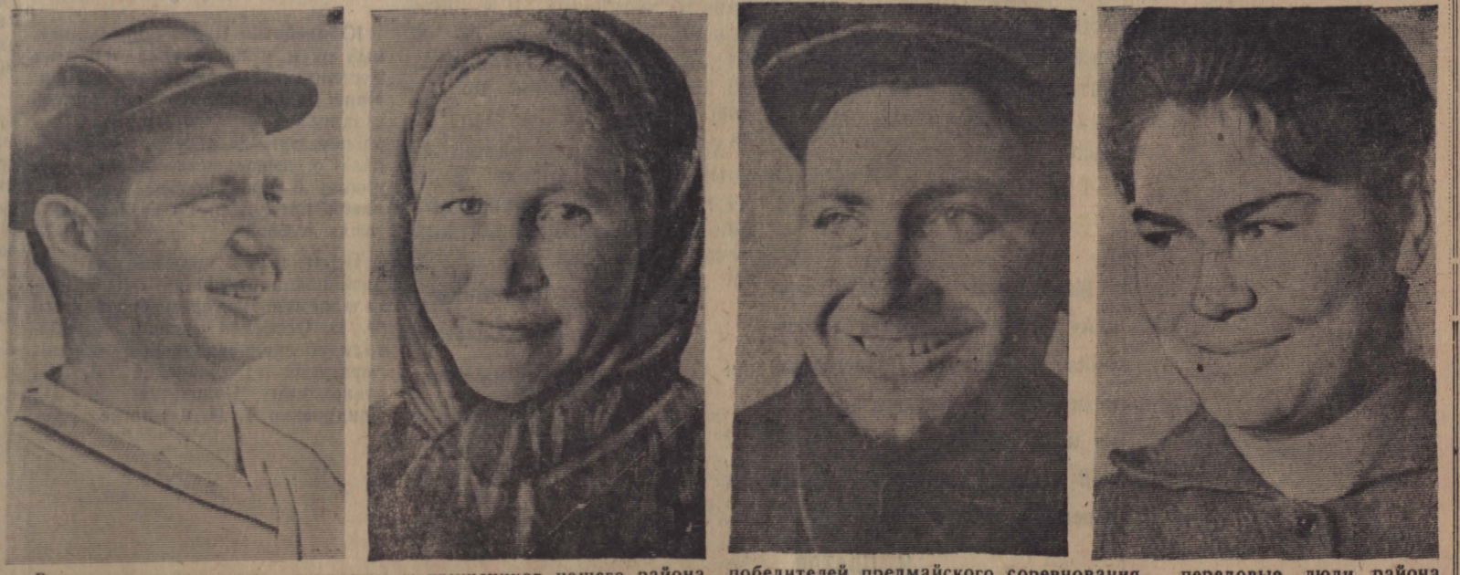
Радостное, праздничное настроение у тружеников нашего района. Хороший разбег взят во втором году пятилетки...