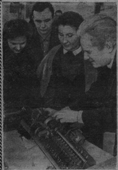
МОСКВА. Коллектив лаборатории механизации процессов птицеводства Всесоюзного научно-исследовательского института электрификации сельского хозяйства в содружестве с сотрудниками Всесоюзного научно-исследовательского института сельскохозяйственного машиностроения создал комплект оборудования для широкогабаритных электрифицированных птичников, рассчитанных на содержание десяти и более тысяч птиц. В него входят механизмы для раздачи кормов, уборки помесения, сбора яиц, для регулирования вентиляции и освещения. Все они обслуживаются одним человеком.

В нескольких совхозах (в Московской, Тамбовской областях, на Северном Кавказе) уже есть птичники, оборудованные такими комплектами.