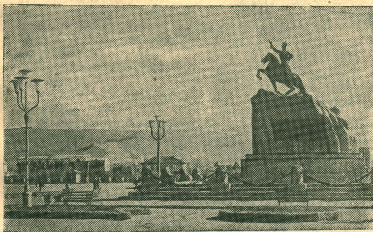
Улан-Батор сегодня. Памятник национальному герою Монголии Сухэ-Батору.

26 НОЯБРЯ ИСПОЛНЯЕТСЯ 43-Я ГОДОВЩИНА ОБРАЗОВАНИЯ МОНГОЛЬСКОЙ НАРОДНОЙ РЕСПУБЛИКИ.