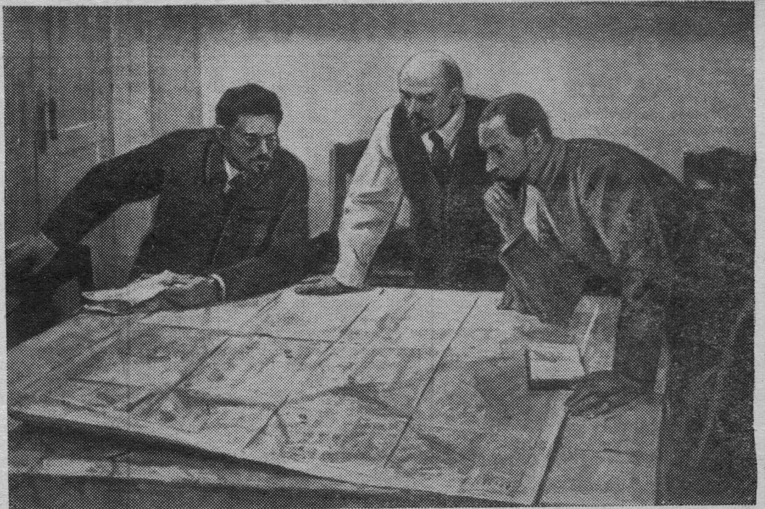
МОСКВА. В Центральном выставочном зале открыта третья республиканская художественная выставка «Советская Россия». На снимке: работа художника В. В. Пименова «Перед штурмом».

На этом вечернее заседание закончилось (Продолж. на 4 стр.)