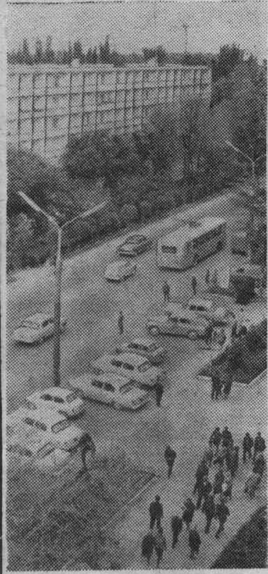
ФРУНЗЕ. Главная магистраль города — улица имени XXII партсъезда.