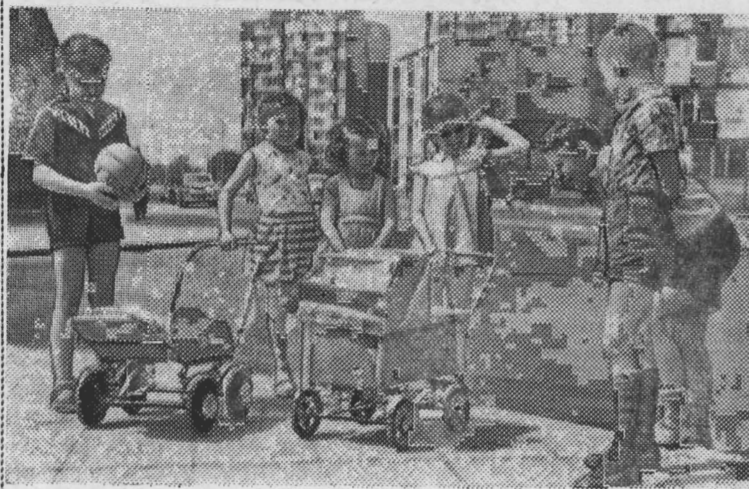
Эти мальчики и девочки живут в новом прекрасном районе польской столицы—Прага II. Одни из них учатся в школе, другие посещают детский сад. Ничто не омрачает их настоящего, а о будущем тоже позаботились взрослые.