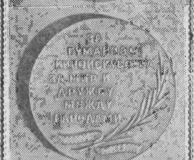
Приз IV Международного кинофестиваля «За гуманизм киноискусства, за мир и дружбу между народами». (Лицевая и оборотная стороны).