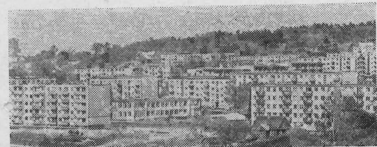
На снимке: новый жилой массив Анткалис, столицы Советской Литвы — Вильнюса, построенный на месте прежних пустырей на берегу реки Нерис.

ОБЪЕДИНЕНИЕ И СПЛОЧЕНИЕ РАВНОПРАВНЫХ НАРОДОВ НА ДОБРОВОЛЬНЫХ НАЧАЛАХ В ЕДИНОМ МНОГОНАЦИОНАЛЬНОМ ГОСУДАРСТВЕ — СОЮЗЕ СОВЕТСКИХ СОЦИАЛИСТИЧЕСКИХ РЕСПУБЛИК, ИХ ТЕСНОЕ СОТРУДНИЧЕСТВО В ГОСУДАРСТВЕННОМ, ХОЗЯЙСТВЕННОМ И КУЛЬТУРНОМ СТРОИТЕЛЬСТВЕ, БРАТСКАЯ ДРУЖБА, РАСЦВЕТ ИХ ЭКОНОМИКИ И КУЛЬТУРЫ — ВАЖНЕЙШИЙ ИТОГ ЛЕНИНСКОЙ НАЦИОНАЛЬНОЙ ПОЛИТИКИ.