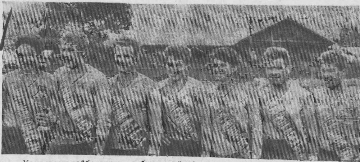
Команда волейболистов—победителей областных соревнований.