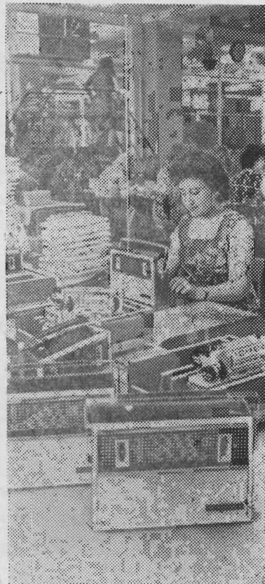
РИГА. За 25 лет в Советской Латвии выросла и изменилась столица республики. Построен ряд новых предприятий, культурных учреждений, учебных заведений, выстроены новые жилые районы.