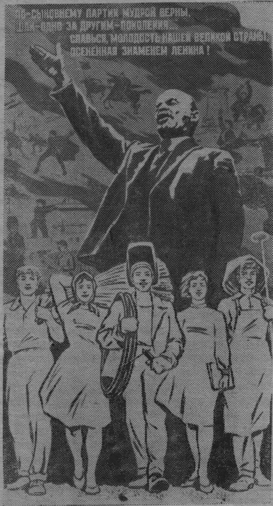
Плакат художника В. Нарышкина.