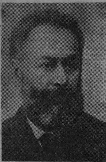
21 июня исполнилось 125 лет со дня рождения АКАКИИ ЦЕРЕТЕЛИ (1840—1915), выдающегося грузинского поэта.