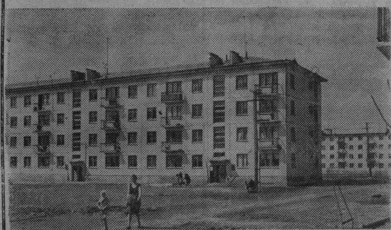
Волгоградская область. 300 квартир со всеми удобствами получили за последние два года рабочие совхоза «Советская Россия». Волгоградский домостроительный комбинат готовит к сдаче еще один дом. Сооружение зданий здесь ведется индустриальными методами.