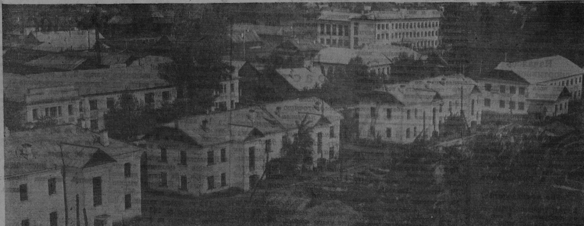
Растет, хорошеет наш поселок Яя.