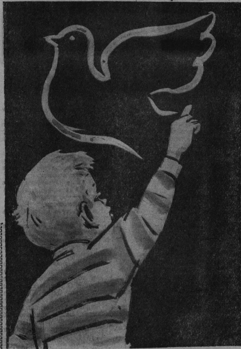
РИС. ДМ. ПАВЛОВИЧА.

Начиная с 1950 года, по инициативе Международной Демократической Федерации Женщин 1 июня каждого года отмечается повсеместно как Международный День защиты детей. Наш народ присоединяет свой голос к голосу народных масс всех стран в защиту детей, за избавление молодого поколения от угрозы войны.